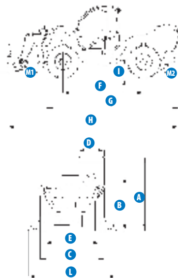
Diagram nosnosti (s podpěrami)