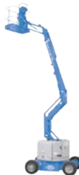
Z™ 34/22 DC - BiE