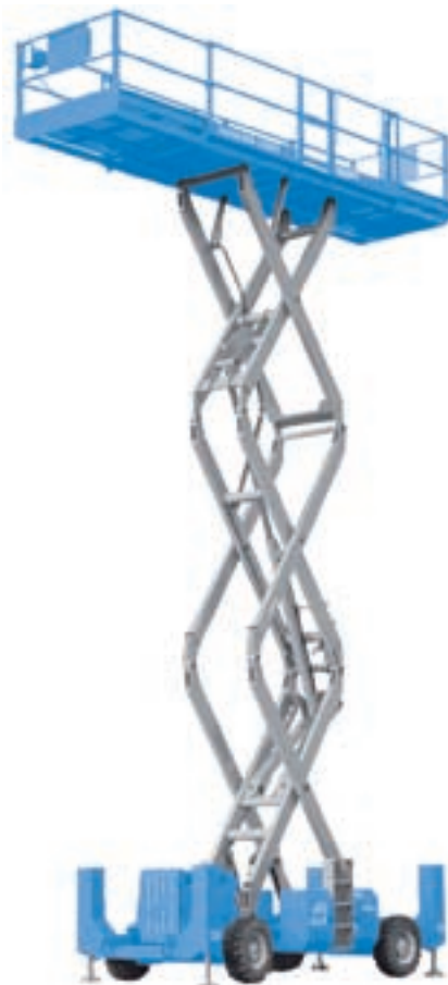
GS™ 3384 RT